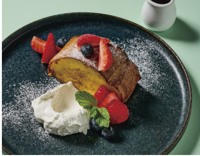
Seasonal Fruit French Toast シーズナルフルーツのフレンチトースト (Egg, Milk, Wheat / 卵、乳、小麦)