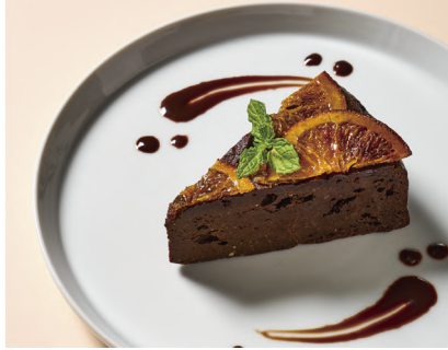
Orangette Gateau Chocolate オランジェットガトーショコラ (Egg, Milk, Wheat / 卵、乳、小麦)