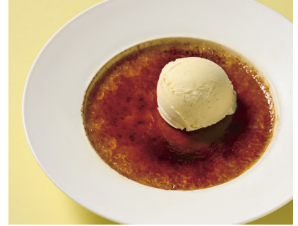
Rich Cream Brulee 濃厚クリームブリュレ (Egg, Milk / 卵、乳)