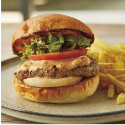
Classic Burger クラシックバーガー