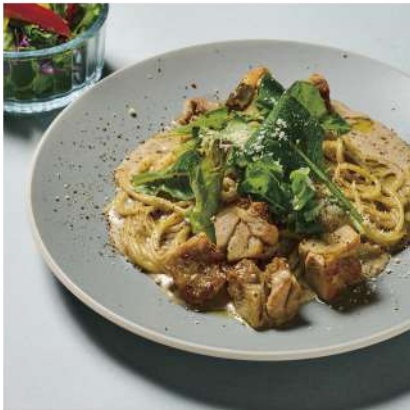
Cream Pasta with Black Truffle and Grilled Chicken