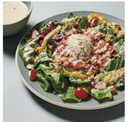
Caesar Salad with Smoked Salmon and Blue Cheese