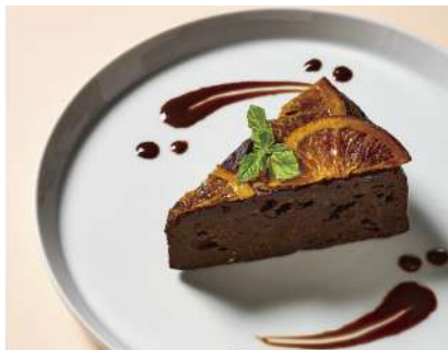
Orangette Gateau Chocolate オランジェットガトーショコラ (Egg, Milk, Wheat / 卵、乳、小麦)