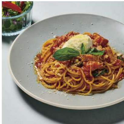
Tomato Sauce Pasta with Bacon and Mascarpone