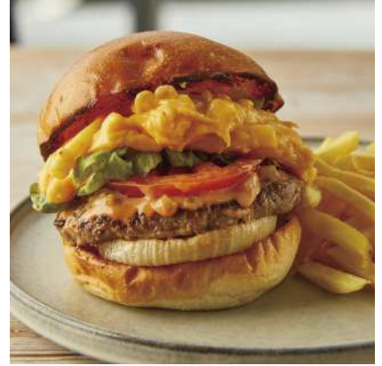
Classic Mac & Cheese Burger クラシックマッケンチーズバーガー