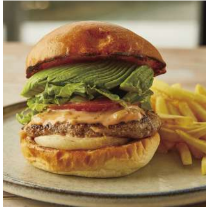
Classic Avocado Burger クラシックアボカドバーガー