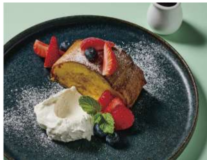
Seasonal Fruit French Toast シーズナルフルーツのフレンチトースト (Egg, Milk, Wheat / 卵、乳、小麦)