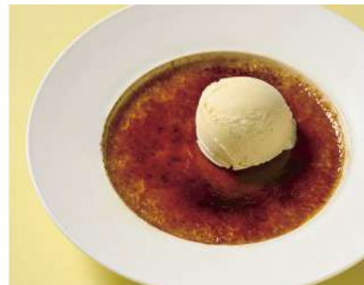
Rich Cream Brulee 濃厚クリームブリュレ (Egg, Milk / 卵、乳)